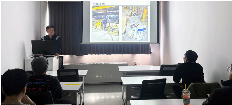
<축로팀 교육 사진>